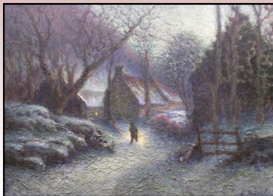
« Tombée de nuit en hiver à Groire » de l'Abbé Boudal

Pour finir, sais-tu ce qu'est l'impressionnisme ?