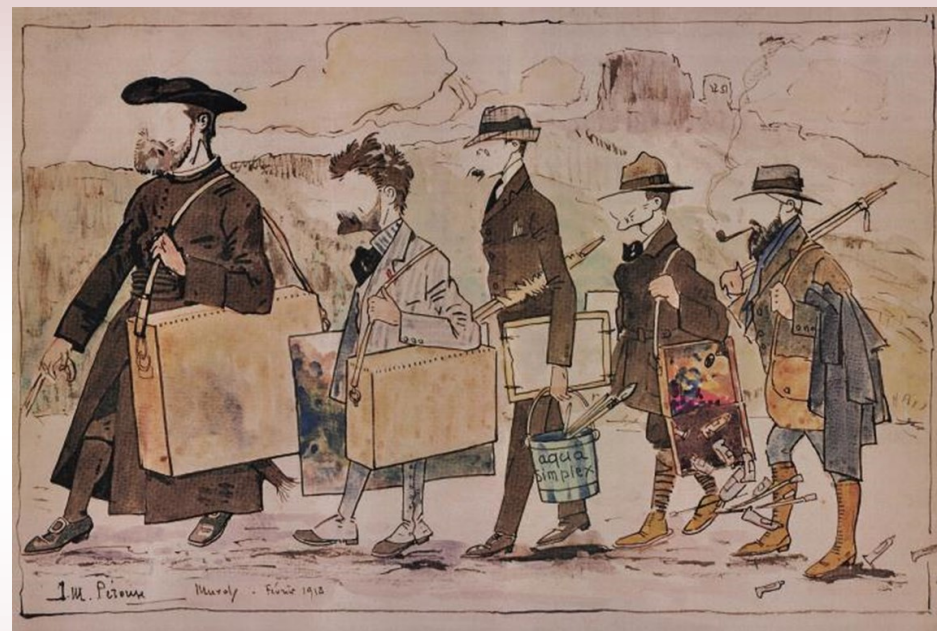
J.M. Pérouse « L'Ecole de Murols en marche »

Tibou va te faire découvrir une école de peinture unique en Auvergne !