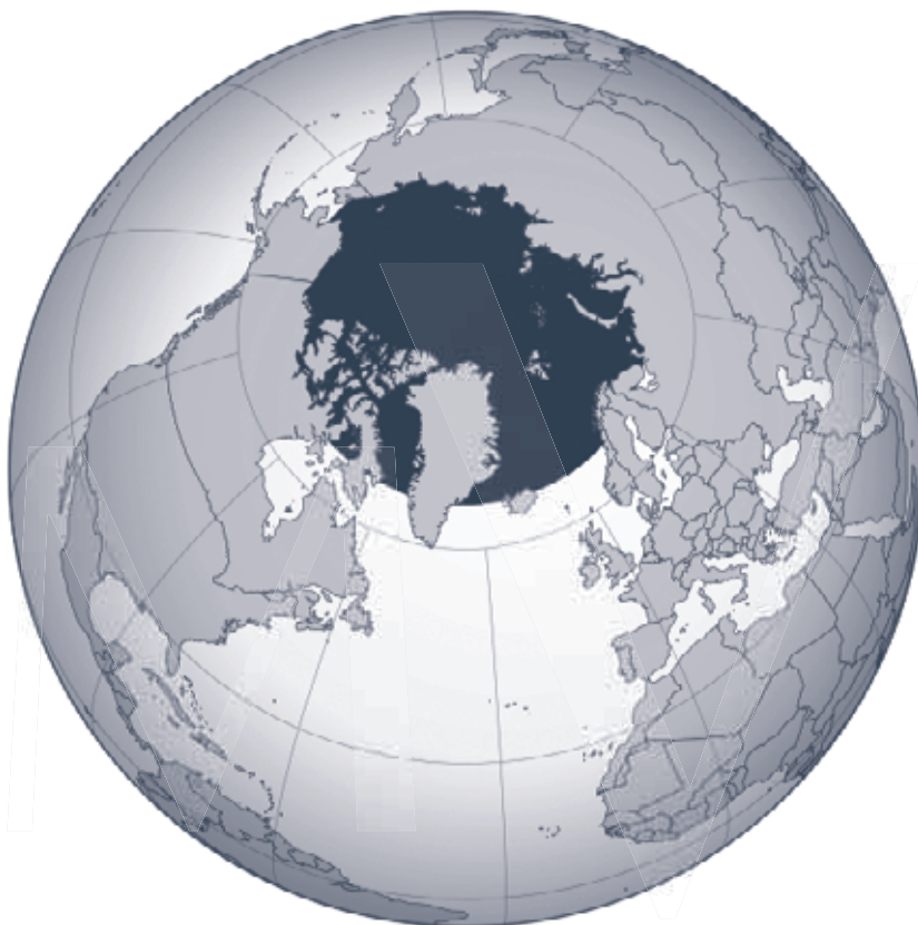
Kaardil Arktika piirkond märgitud tumeda värviga.

vaadata ei saa. Või ideaalses maailmas vähemalt ei tohiks.