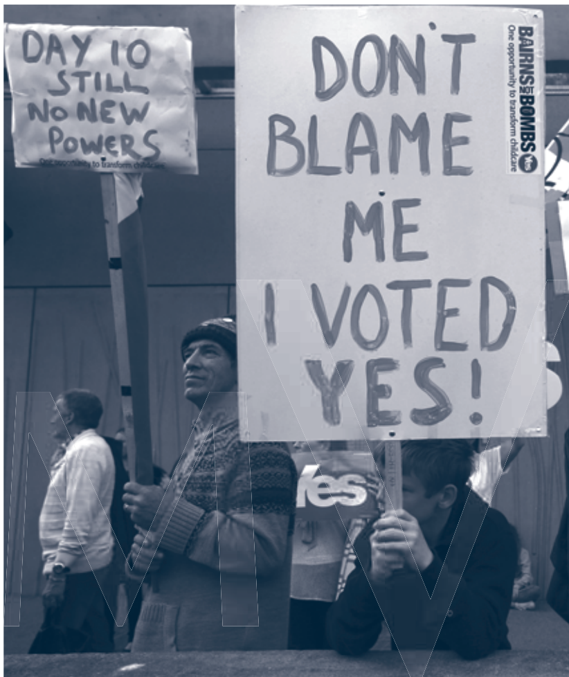
Iseseisvuse pooldajad protesteerivad Edinburghis Šoti parlamendi ees, 28. septembril 2014. Šotimaa Ühendkuningriigi koosseisu jäämisega päädinud referendum järel lubas Briti valitsus anda piirkondlikele omavalitsustele rohkem õigusi.

Kurioosumina tasub märkida, et Šotimaal ei ole kunagi saanud asetada võrdlusemärgi „valin Šoti rahvuslasi (SNP)” ja „tahan iseseisvat Šotimaad” vahele. Šotimaalastelt on aastaid – täpsemalt 1986. aastast alates – küsitud, kas nad tunnevad end vaid šotlastena, pigem šotlaste kui brittidena, võrdselt šotlase ja britina, pigem briti kui šotlase või ainult britina 1 . Vastuseid sellele küsimusele on võrreldud valimiskäitumisega ja suhtumisega Šotimaa iseseisvusesse. Ühisosa on loomulikult olemas, ent mitte täielik. Ka enne iseseisvusreferendumit näitasid küsitlused, et ligi viiendik Šoti Rahvuspartei toetajatest ei plaani referendumil jah-sõna öelda, samas kui umbes kolmandik Šoti leiboristidest olid iseseisva Šotimaa poolt.